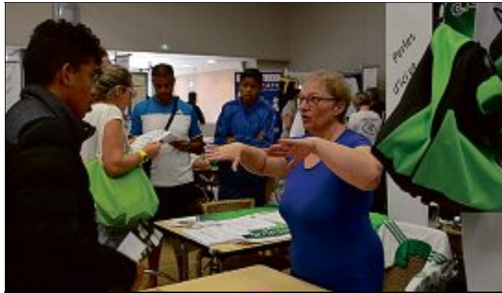
AU CHOIX. Les associations et clubs proposent de multiples loisirs.

Vernouillet fait sa rentrée en mode associatif. Activille est l'occasion de mettre en valeur un vivier d'activités proposées dans la commune ou chez sa grande voisine, Dreux. Une trentaine d'associations ont déjà confirmé leur présence dans le parc de l'Agora, l'ex salle des fêtes joutant la mairie : Bridge club de Dreux-Vernouillet, LM danse, Kyokushin Tora-Senshi,