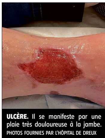
ULCÈRE. Il se manifeste par une plaie très douloureuse à la jambe.

600.000 patients concernés par an, en France.