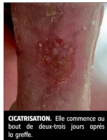
CICATRISATION. Elle commence au bout de deux-trois jours après la greffe.