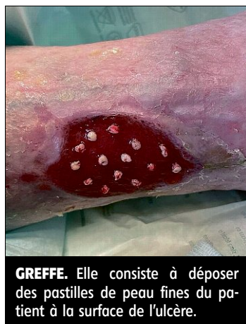
GREFFE. Elle consiste à déposer des pastilles de peau fines du patient à la surface de l'ulcère.