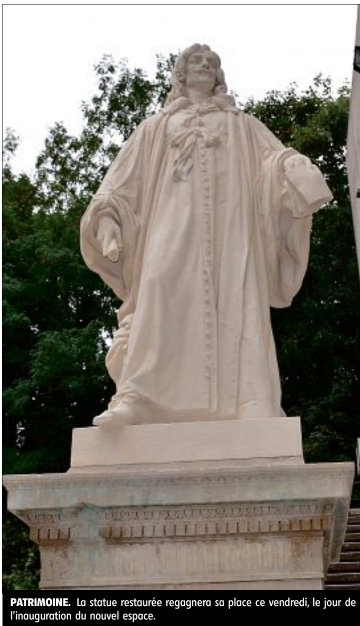
PATRIMOINE. La statue restaurée regagnera sa place ce vendredi, le jour de l'inauguration du nouvel espace.

taurée quelques traces vertes qui évoquent la couleur du bronze. « C'est très bien. Cela raconte l'histoire de la statue », indique Fouzia Kamal.