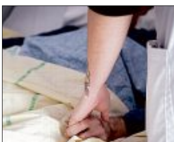
SOINS PALLIATIFS. Les correspondants du service seront sur place jeudi.

parler de la loi Leonetti, les deux outils mis à sa disposition sont souvent méconnus. Pour permettre aux patients de devenir acteurs de leur santé, l'hôpital de Dreux organise, jeudi de 14 à 16 heures, une journée d'information sur le sujet.