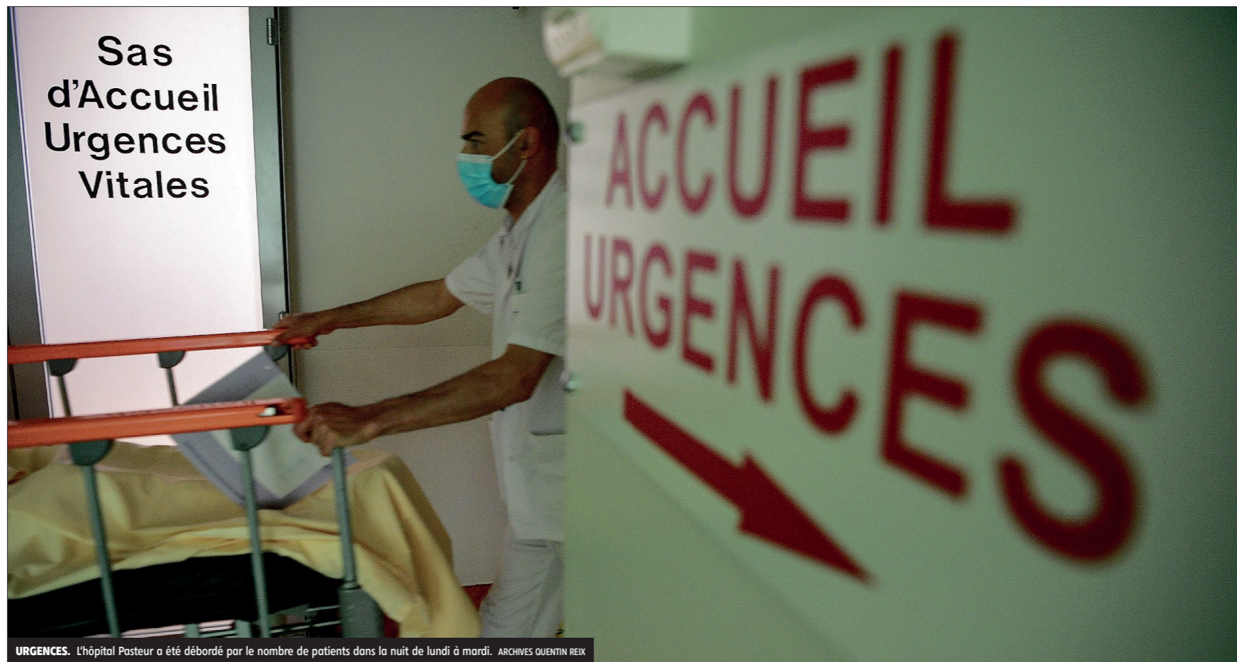
URGENTES. L'hôpital Pasteur a été débordé par le nombre de patients dans la nuit de lundi à mardi.

Les syndicats FO des hospitaliers de Chartres et la CGT dénoncent, de leur côté, une saturation « inédite » des urgences, liée à la désertification médicale - « les patients n'ont plus de médecin traitant et ils laissent leur situation se dégrader » - et à une politique de fermeture de lits à laquelle ils s'opposent « depuis des années. On voit ce