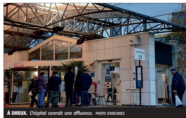
À DREUX. L'hôpital connaît une affluence.

Le centre hospitalier Victor-Jousselin, à Dreux, ne fait pas exception : il vit des heures difficiles à cause du pic de l'épidémie de grippe qui n'épargne aucune région de France.