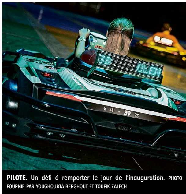
PILOTE. Un défi à remporter le jour de l'inauguration.

Hospitalisé pendant plusieurs jours pour un asthme sévère, il fait partie des 20 enfants malades pris en