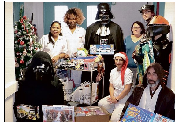
CADEAUX. Les cosplayers ont inondé l'hôpital de cadeaux.