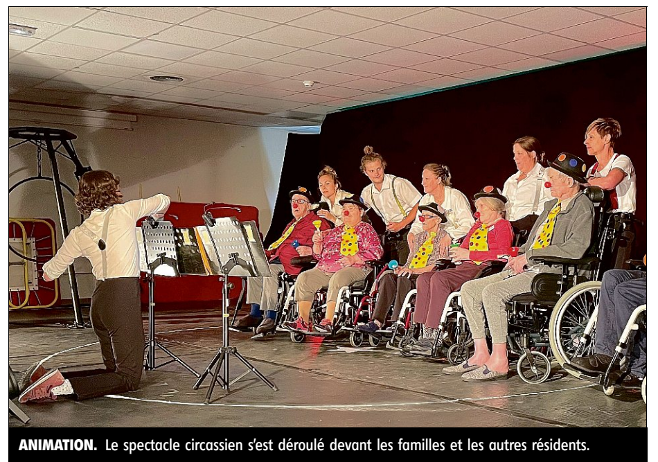
ANIMATION. Le spectacle circassien s'est déroulé devant les familles et les autres résidents.