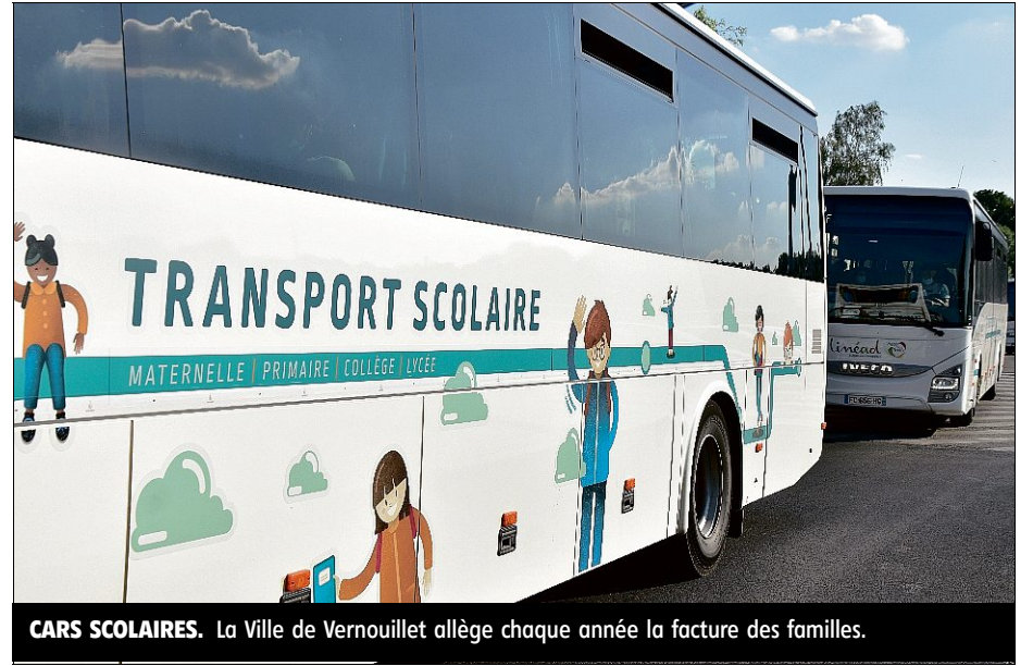
CARS SCOLAIRES. La Ville de Vernouillet allège chaque année la facture des familles.

En fonction du quotient familial, le reste à charge pour les familles aux revenus les plus faibles s'élève à 32 € pour les parents d'un collégien ou lycéen. Les familles aux revenus plus favorisés, situées dans la tranche 7 du quotient