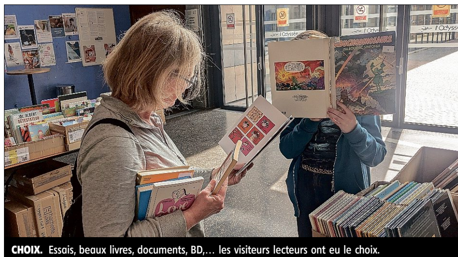
CHOIX. Essais, beaux livres, documents, BD, ... les visiteurs lecteurs ont eu le choix.

Les prochains rendez-vous. Mercredi 14 mai : club de lecture des Mange-livres, de 16 à 17 heures. Samedi 17 mai : atelier de français (non francophones), de 10 h 30 à 11 h 30 ; 16 à 17 heures, club manga (10-14 ans) ; de 17 h 30 à 21 h 30, grande soirée jeux (tous publics). Renseignements : 02.37.82.68.20.