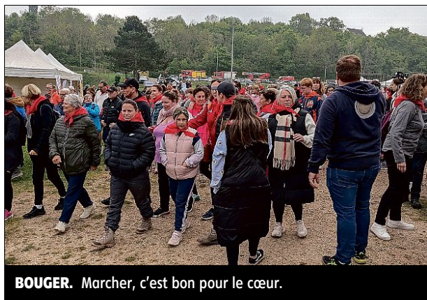
BOUGER. Marcher, c'est bon pour le cœur.

Un succès fou ! Près de 300 personnes ont participé dimanche matin aux Parcours du Cœur, à Vernouillet.