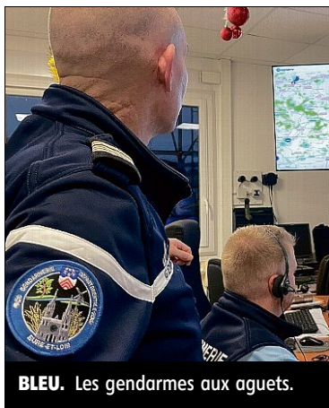
BLEU. Les gendarmes aux aguets.