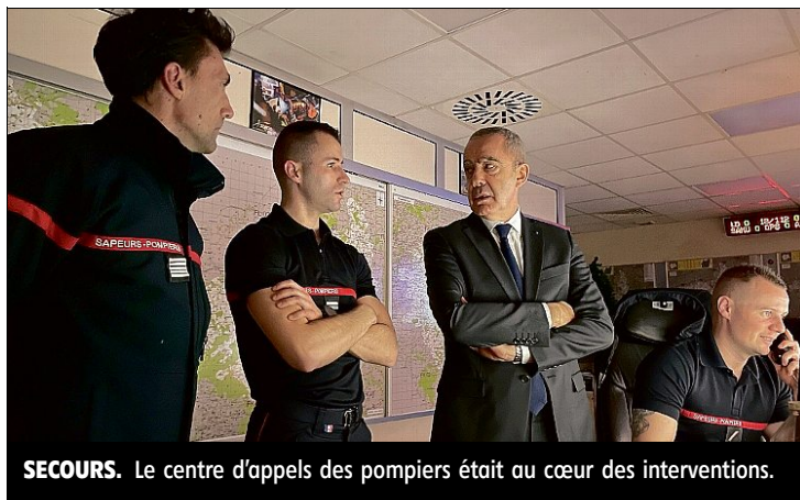
SECOURS. Le centre d'appels des pompiers était au cœur des interventions.