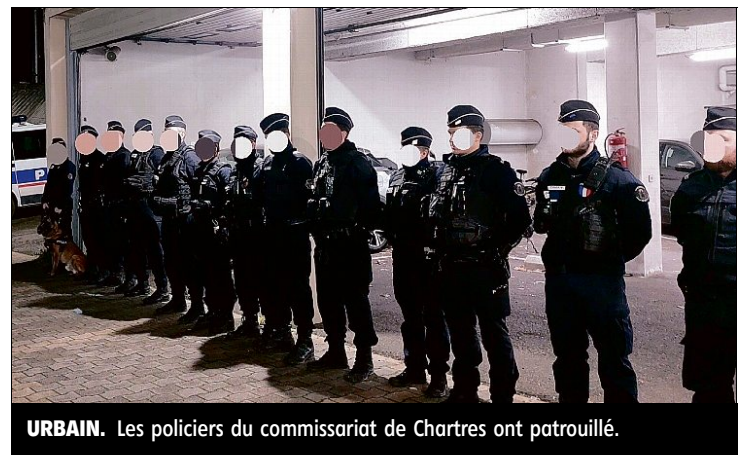
URBAIN. Les policiers du commissariat de Chartres ont patrouillé.