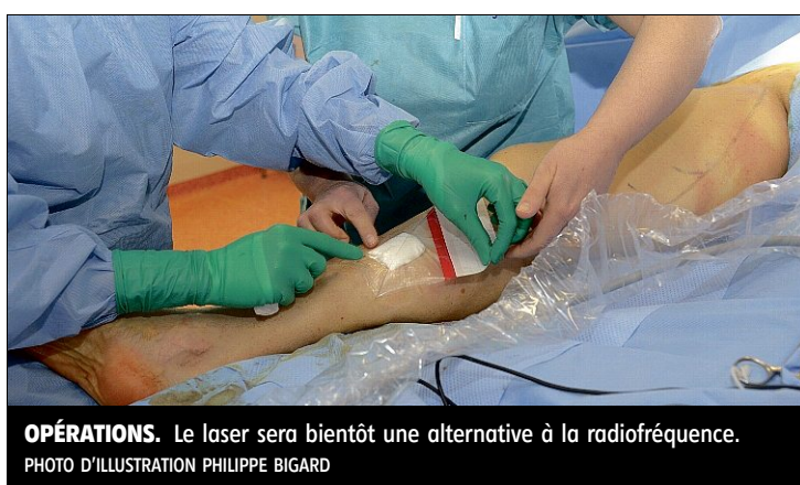
OPÉRATIONS. Le laser sera bientôt une alternative à la radiofréquence.