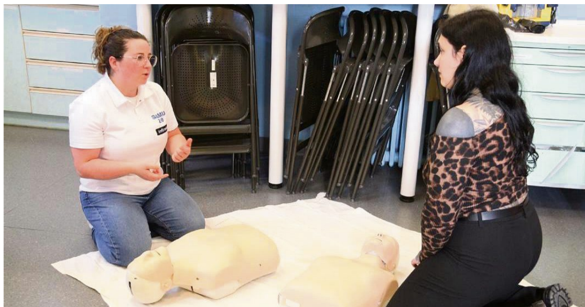
Une élève infirmière de l'IFPP apprend les gestes d'urgences à une visiteuse.