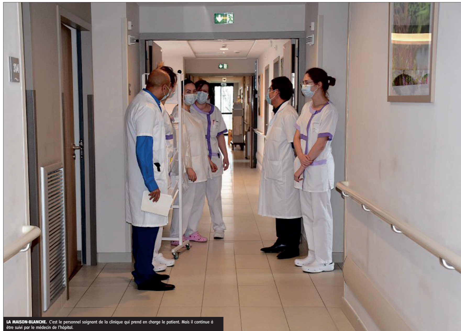
LA MAISON-BLANCHE. C'est le personnel soignant de la clinique qui prend en charge le patient. Mais il continue à être suivi par le médecin de l'hôpital.

L'idée est également d'éviter au maximum la déprogrammation des interventions hors Covid. Éviter un maximum de retarder des soins en apparence non urgents mais qui laissent des malades chroniques sur le bord du chemin de la santé. Créer un groupement hospitalier de territoire de fait pour assurer une filière santé sur le Drouais. ■