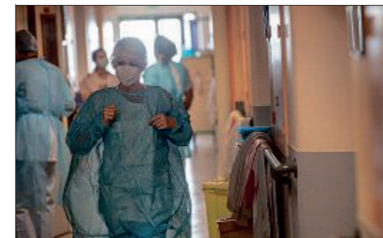
SURCHAUFFE. Le nombre de patients admis à l'hôpital est en augmentation sur le département.

Autre source d'inquiétude pour les autorités de santé, le variant anglais désormais détecté dans 85 % des cas. Le taux de positivité s'élève à 9,9 %, sur la