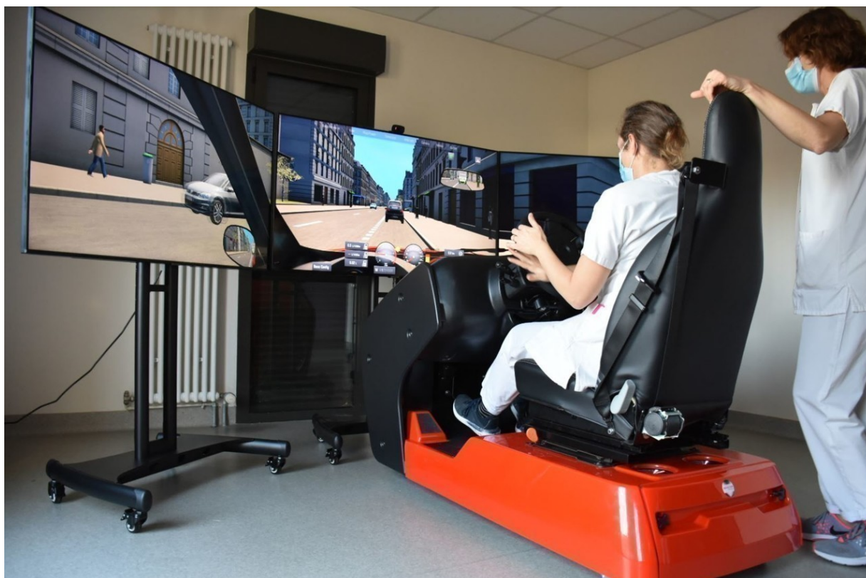
Un simulateur automobile au centre de rééducation de Dreux.

Dans un futur proche, le centre aimerait accueillir et soigner des sportifs de haut-niveau.