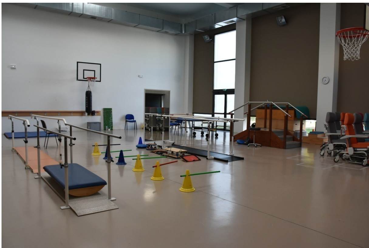
Le gymnase du centre de rééducation de Dreux

Les professionnels de santé se relaient pour assurer une prise en charge complète et pluridisciplinaire pour les patients, qui ont jusqu'à six séances par jour.