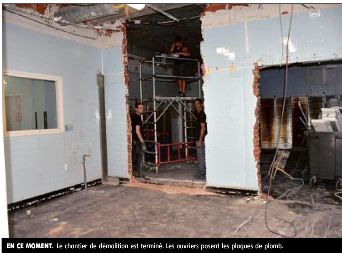
EN CE MOMENT. Le chantier de démolition est terminé. Les ouvriers posent les plaques de plomb.